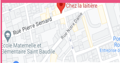
Maison des Mistons 61 rue Pierre SEMARD